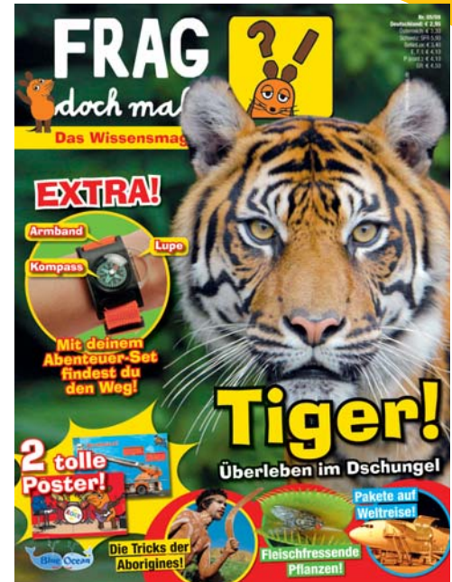
© I. Schmitt-Menzel, WDR mediagroup licensing GmbH Die Sendung mit der Maus ©, WDR