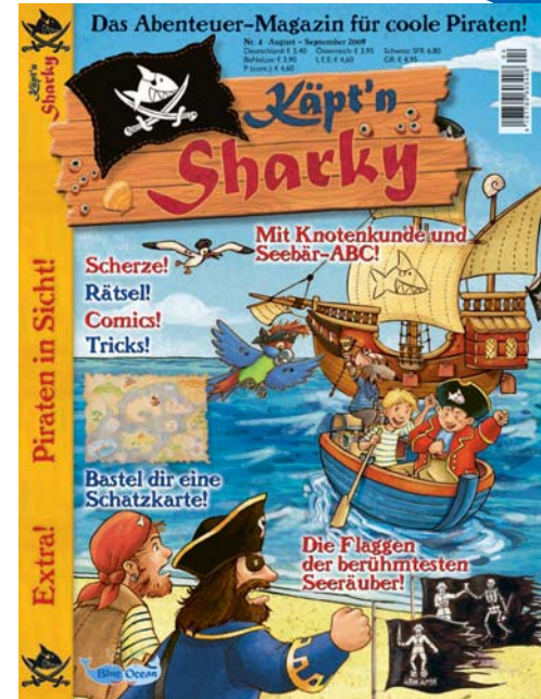
Käpt'n Sharky © Coppenrath Verlag, Münster

* Quelle: verlagsinterne Angaben/Leserbefragung