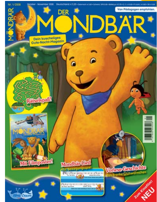
Mondbär © Copenrath Verlag, Münster