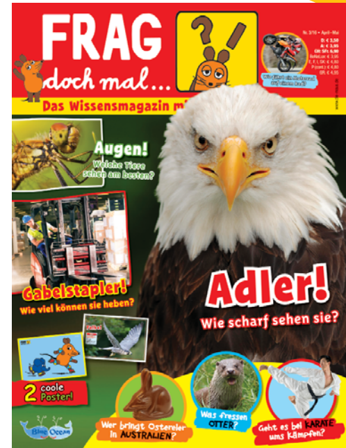
© I. Schmitt-Menzel, WDR mediagroup licensing GmbH Die Sendung mit der Maus ©, WDR

Mitlesende Eltern: 87 % der Eltern lesen Ausgaben von FRAG doch mal die Maus mit. laut KidsVA 2015