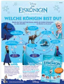
Kunde: The Walt Disney Company

In enger Abstimmung mit Ihnen entwickeln wir passgenaue Kommunikationskonzepte und setzen diese um, damit Sie Ihr Produkt wirkungsvoll, individuell und zielgruppengerecht bei den Leserinnen und Lesern platzieren können.