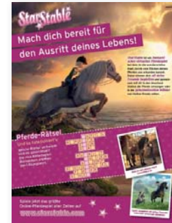
Kunde: Star Stable Entertainment AB

Spielerisch und wirkungsvoll! Auf der Spielfeld-Anzeige von Nintendo können sich die Kids durch die ganze Produktwelt von Nintendo spielen.